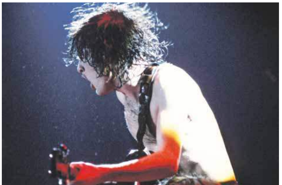
Absolut fotogen: Rockmusik der 1980er-Jahre.