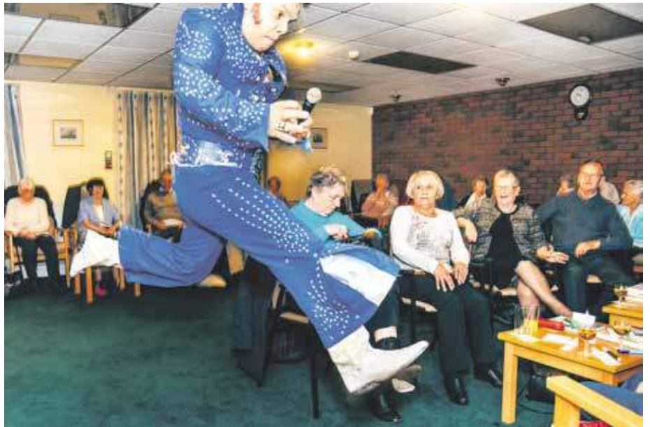
Ein King hebt ab: Elvis im Altersheim.