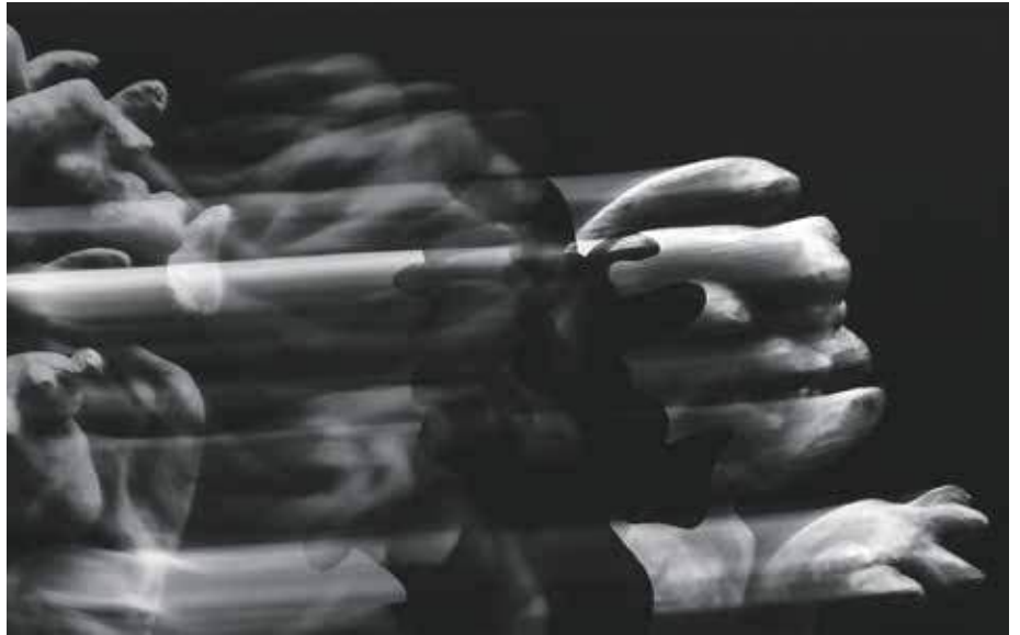
Seraina Marchals Interpretation von Mussorgsky.

// Schlossgutareal und Dorfzentrum, Münsingen Do., 9., bis So., 12.5. www.photomuensingen.ch