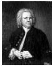
Johann Sebastian Bach.

Dass die mehr als zwei Dutzend Einzelteile von Bachs Hoher Messe in h-Moll nie als zusammengehörige Komposition geplant und konzipiert waren, ist längst bekannt, hat aber der Popularität der Schöpfung nie geschadet. Im Ge-