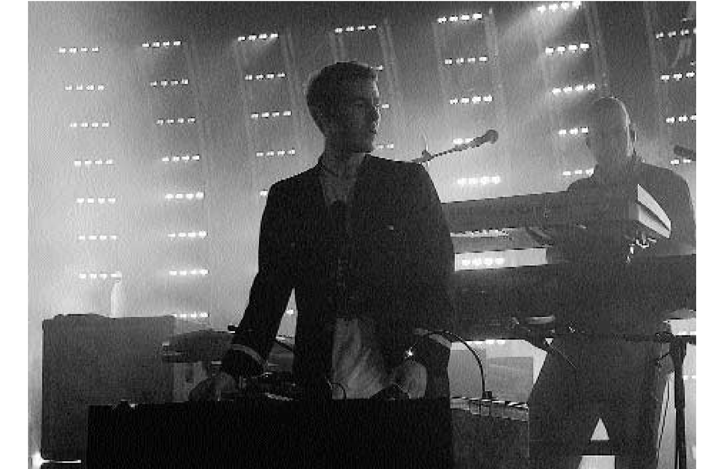
Magische Verschmelzung: Die eisigen Klangweiten der britischen Gruppe Massive Attack . . .

In Montreux haben vor dieser magischen Verschmelzung zunächst beide Parteien ein Konzert lang Zeit, ihre Verlockungen auszubreiten. Terry Callier tut dies kraft eines Sets, in dem sich der Soul in alle Himmelsrichtungen ausbreitet, ganz besonders gerne aber gegen Süden. Immer wieder sind Reminiszenzen an die Latin-Musik zu vernehmen, doch Terry Calliers Soul ist mehr als das. Er ist mal swingender Jazz, mal stilvoller Rock 'n' Roll, mal himmeltrauiger Blues, mal Frieden stiftender Folk,