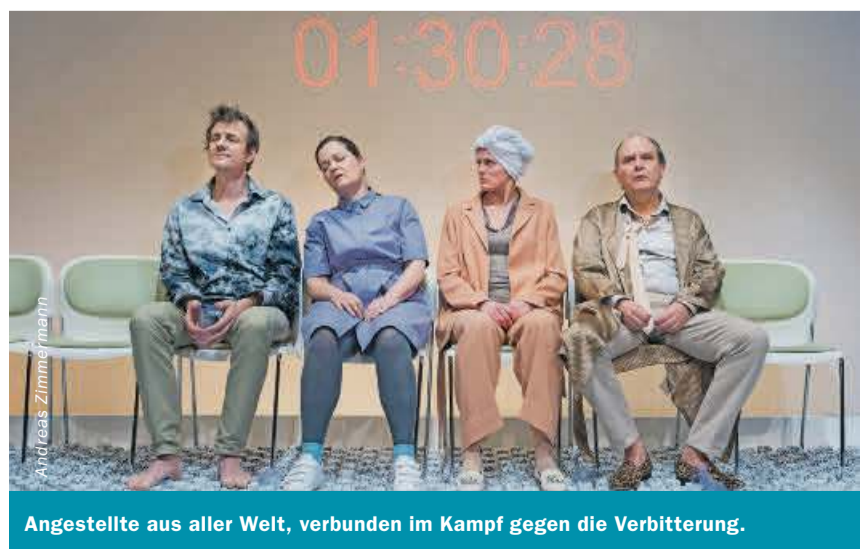
Angestellte aus aller Welt, verbunden im Kampf gegen die Verbitterung.

Tojo Theater Reitschule, Bern Premiere: Mi., 31.5., 20.30 Uhr Vorstellungen bis 3.6. www.tojo.ch Wir verlosen 2 x 2 Tickets für Mi., 31.5.: tickets@bka.ch