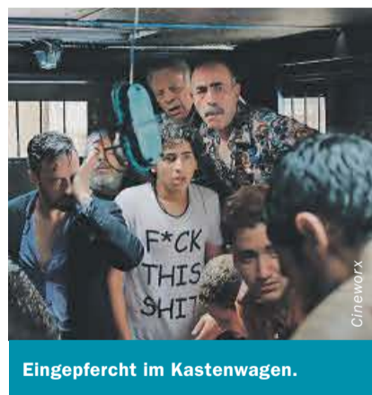
Eingepfercht im Kastenwagen.

Keine leichte Kost: Der ägyptische Film «Clash» von Mohamed Diab zeichnet ein erschütterndes Bild vom Ende des Arabischen Frühlings. Zu sehen ist er im Kino Rex.