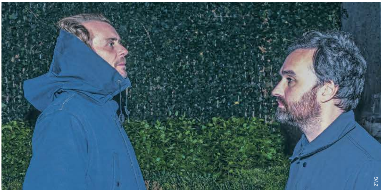
Ein okkultes Vergnügen: Das Duo Demdike Stare spielt an der langen Nacht der elektronischen Musik.

Dampfzentrale, Bern Do., 25.5., 21 Uhr www.dampfzentrale.ch